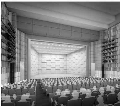
大ホールフォレスト