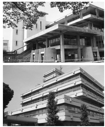
被災し使用できなくなった旧市民会館（上）、旧本庁舎（下）

した。そのため、庁舎の分庁化やイベント場所の変更等で大変不便な状況が続きました。