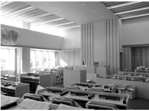
新本庁舎4階市議会本会議場 (平成28年12月)

新本庁舎の完成で、市議会をはじめとした、現在分散している市庁舎のさまざまな機能が集約され、利便性が格段に向上します。さらに、建設工事中にも発生した大雪や地震といった災害に対し、市民の安全を守るための災害対策本部として、十分な機能を備えています。