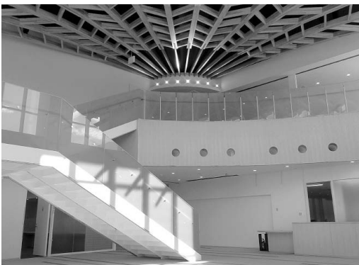
新本庁舎エントランスホール (平成28年12月)

一方、新市民会館に目を向けると、1,007席の客席を持ち、最新の舞台設備を備えた「大ホール フォレスタ」があります。このホールは、市民の皆さんのさまざまな活躍の場としての期待に応えらるとともに、良質なエンターテインメントの提供の場としても、十分な機能をもっています。