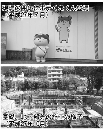
現場の囲いにボテくまくん登場（平成27年7月） 基礎、地下部分の施工の様子（平成27年10月）

秩父夜祭が終わり、冬になると、地上部分の鉄骨工事が始まり、囲いの外からも工事の様子が分かるようになってきました。平成28年に入り、1月には大雪に見舞われ、