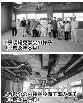
工事現場見学会の様子（平成28年8月） 庁舎部分の内装、設備工事の様子（平成28年9月）

この時期には、市民の皆さんに実際の工事現場を見ていただく見学会を開催することができました。