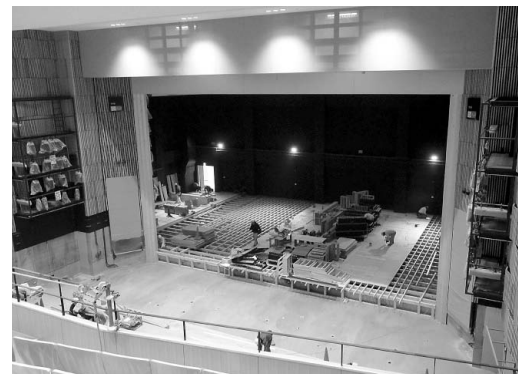
大ホール フォレスタ (平成28年12月)

一方、新市民会館に目を向けると、1,007席の客席を持ち、最新の舞台設備を備えた「大ホール フォレスタ」があります。このホールは、市民の皆さんのさまざまな活躍の場としての期待に応えらるとともに、良質なエンターテインメントの提供の場としても、十分な機能をもっています。