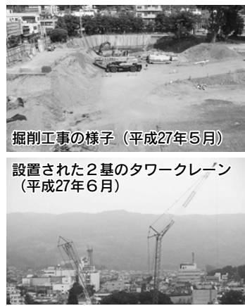
掘削工事の様子（平成27年5月） 設置された2基のタワークレーン（平成27年6月）

トしました。平成27年の春ごろまでは建物の基礎を造るための掘削工事などを行い、その後、夏から秋にかけて、基礎、地下階の構築などを行いました。この間は、囲いの外から建設の様子が見えづらいう状況が続きましたが、秩父地域では珍しい高さ100メートルに及ぶ2本のタワークレーンの動きが、工事の進行を外部に伝える役目を果たしていたかと思えます。