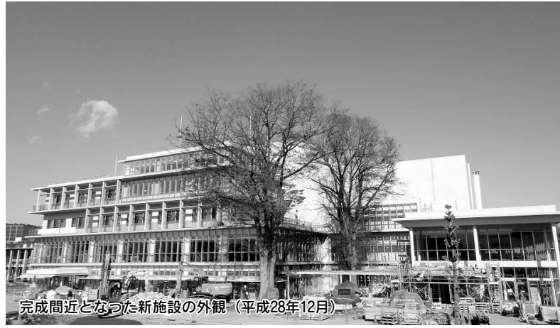
完成間近となった新施設の外観（平成28年12月）

平成26年12月に着工した建設工事が、いよいよ本年2月をもって完了します。市民の皆さんが待ち望んでいた新しい秩父宮記念市民会館、そして秩父市役所本庁舎がついに完成します。 新年にあたり、改めて建設の経緯、工事の進行状況などを振り返るとともに、新施設の持つ可能性や今後のスケジュール等をお知らせします。