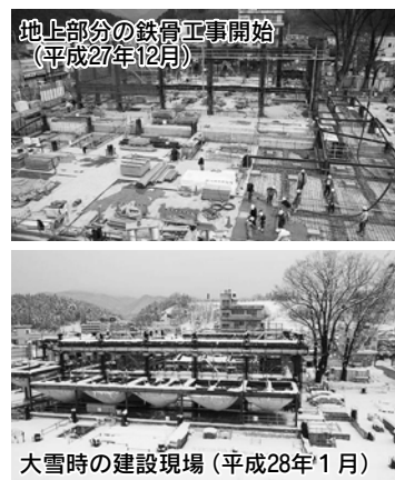
地上部分の鉄骨工事開始（平成27年12月） 大雪時の建設現場（平成28年1月）

工事の進行が遅れるトラブルもありましたが、その後は順次工事を進め、夏には建物の躯体がほぼ完成しました。